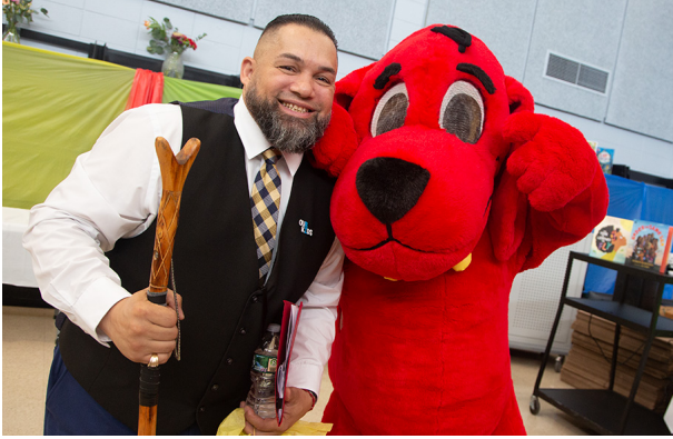
ډاکټر. جاویر مونتانیاز رئيس

د پرواډینس عامه ښوونځې د تعلیمي حوزې (PPSD) د دوه-اوونیزې خبرپاڼې وروستی نسخې ته ښه راغلاست! زه په ډیره خوښۍ سره اعلان کوم چې مور تیره اونۍ د لیسې نهه فراغتونو درلودل، له 1,000 څخه ډیر زده کونکي د ډیپلومونو ترلاسه کولو لپاره د سټیج سر ته راغلل. تاسو ټولو ته د پای لیک ته د رسیدو مبارکي وایم. تاسو دا ترلاسه کړ. همدارنگه د اتم ټولگي ټولو هغو زده کوونکو ته چې د دوی د پورته تگ مراسم یې په لاره اچولي وو، د زړه له کومې مبارکي وایم تیره اونۍ د فراغتونو په مینځ کې، مور د دوبي لوستلو نوښت پیل کړ. مخکې له دې چې ښوونځي پای ته ورسیري، مور د عمر له مخې 90,000 کتابونه د K تر پنځم ټولگي پورې ټولو زده کوونکو ته وپیشل. مور د اوړي د لوستلو نوښت لپاره د پیل کولو برخې په توگه د آسا میسر لومړني ښوونځي د کلیفورډ لوی ریډ سپي څخه لینډه هم درلوده.